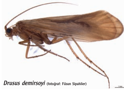
Drusus demirsoyi

ların çıktığının belirtti. Önümüzdeki yıllarda da Türk araştırmacılarının tanımladığı tür sayısında, dolayısıyla “demirsoyus, demirsoyi” gibi adlandırmaların, önemli oranda artış olacağını belirtti. Bu sayımızda bu türlerden üç tanesini inceleyeceğiz.